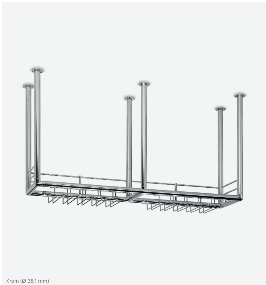
Krom (Ø 38,1 mm)

Modell 430 är ett elegant alternativ med en klassisk, tidlös design. Vi kan enkelt anpassa måtten i enlighet med kundens förutsättningar. Välj rörtjocklek (Ø 25,4 mm eller Ø 38,1 mm), glashängardjup (300, 350 eller 400 mm) med eller utan glasskiva och mellan fyra olika ytbehandlingar.