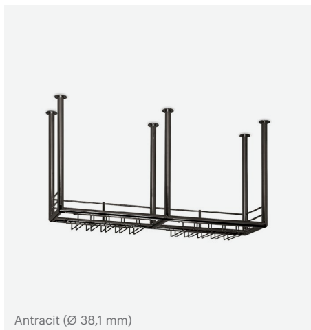
Antracit (Ø 38,1 mm)